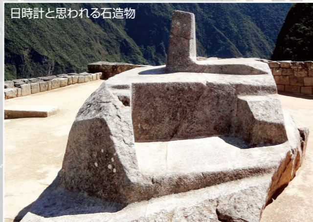
日時計と思われる石造物