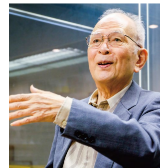
Oさん(男性) 週2回の訪問リハビリを利用中。 屋外歩行訓練を中心に、積極的に リハビリに取り組まれています!

「あなたの残された人生の中では、今のあなたは一番若い」。この言葉は当院の訪問リハビリを利用されているOさんが大事にされている言葉です。最近縁が有り、一緒にFM-HANAKO(82.4MHz)に出演させていただきました。その番組の中で、Oさんがハーモニカの生演奏をして下さいました。以前に舞台上のカルテットでのマイクを通した演奏はお聞きしていましたが、マイクを通さない生音、それもソロ演奏であるにもかかわらず、演奏者が数人いるように聞かせる技術や、何よりその音圧にただただ圧倒され、ラジオ本番中であることも忘れてしまいそうほど感激しました。