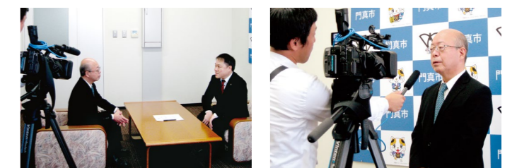
締結の様子は、J・COMで放送されました。