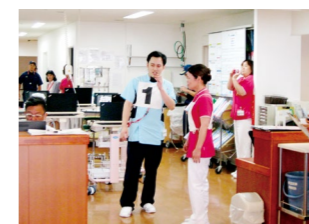
水消火器を使用しての消火訓練