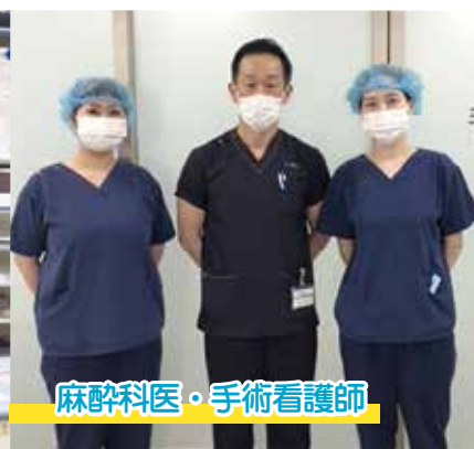
麻酔科医・手術看護師