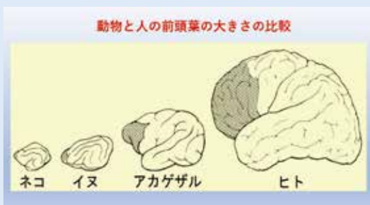
人間の前頭葉は他の動物に比べてかなり大きい