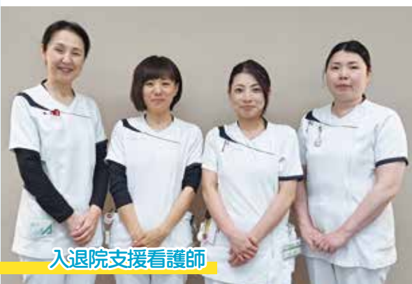
入退院支援看護師