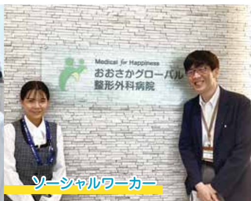
ソーシャルワーカー