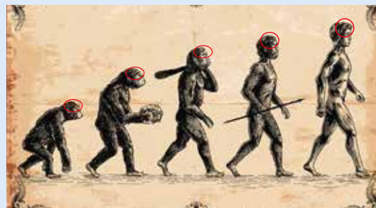
人が進化するごとに前頭葉が発達してきた