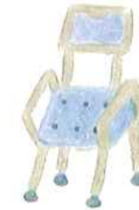
福祉用具 レンタル・購入