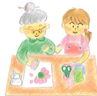
デイサービス・デイケアサービス・ショートステイ