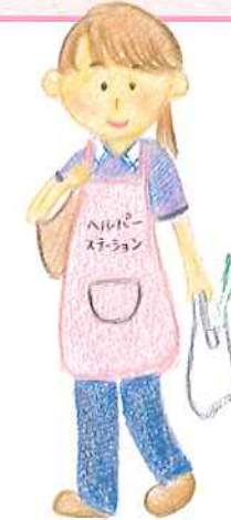
ヘルパーサービス