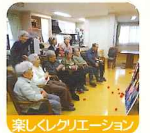
楽しくレクリエーション