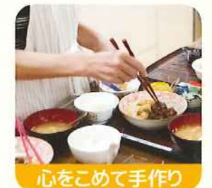
心をこめて手作り