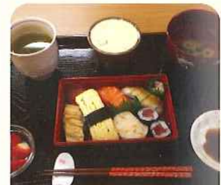
お寿司の出前の日も

毎日配達される新鮮な国産の食材を使用 管理栄養士と相談の上、バランスの良い食事を 職員が心をこめて手作りしています。