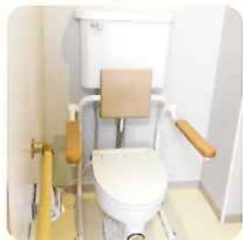
夜中でも安心 各部屋にお手洗い完備