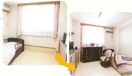
使い慣れた家具や小物で お部屋をご自宅のようにくつろげるスペースに