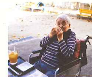
地域の喫茶にお出かけ