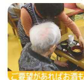
ご要望があればお酒も