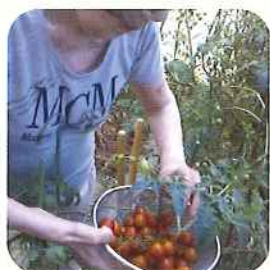
茄子やミニトマトが沢山収穫できました。