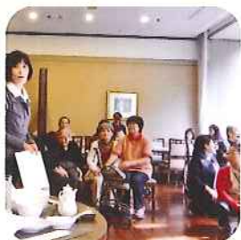
ホテルでの家族会