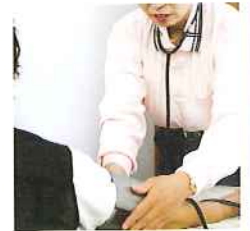
牧訪問看護ステーション