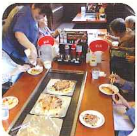
外食へお出かけする日もあります。