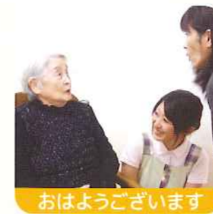
おはようございます