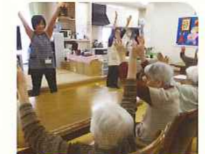
手足を動かす体操